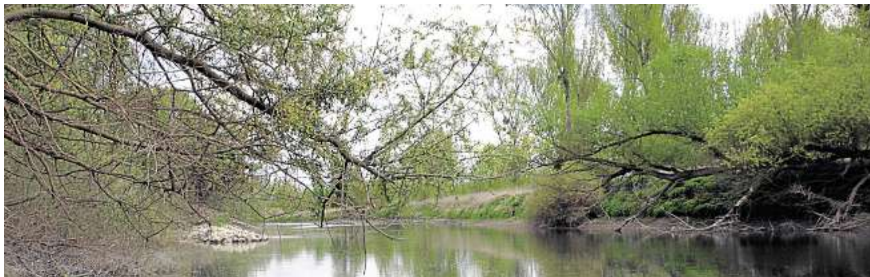
Das Naturschutzgebiet Kühkopf wird von zahlreichen Altrheinarmen umflossen und beheimatet 300 Vogelarten.

gleich, dass man gewissermaßen das Festland verlässt und überwechselt auf eine Insel. Was beim Kühkopf aber auch nicht ganz richtig ist, denn das 1 700-Hektar-Gebiet liegt ja nicht als Insel im Rhein, sondern wird von Hauptstrom und Altrheinarmen umflossen. Wobei Letztere den ursprünglichen Flusslauf bis 1828 darstellen, der Rhein also einst um den Kühkopf herum mäanderte.